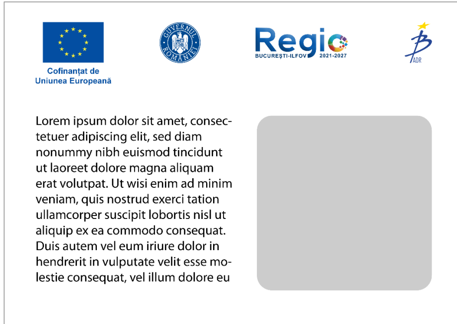
Exemplu pagină web