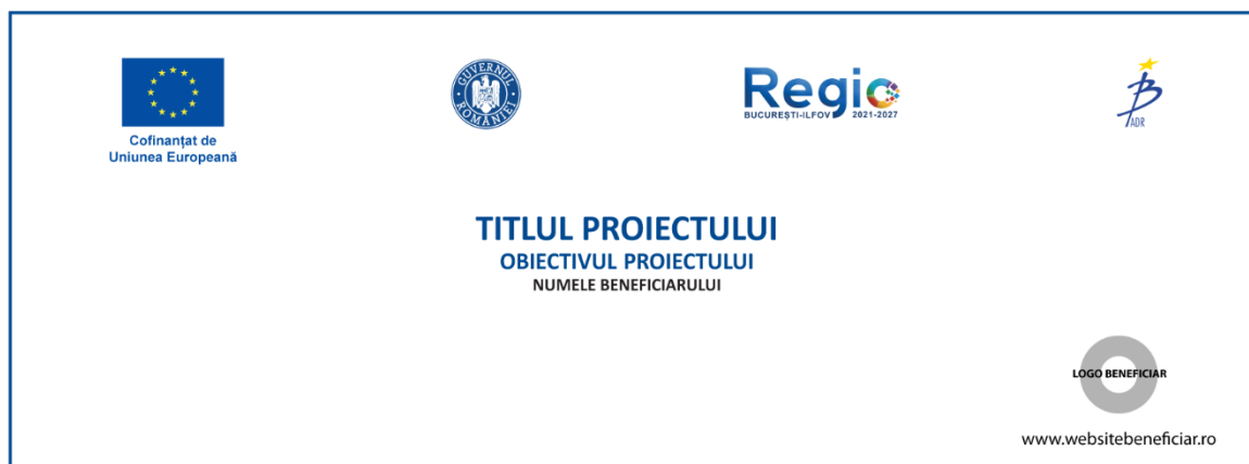
Exemplu banner orizontal