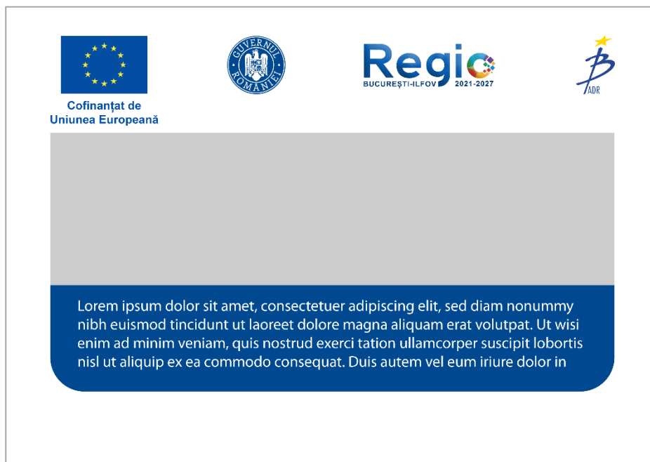
Exemplu template social media